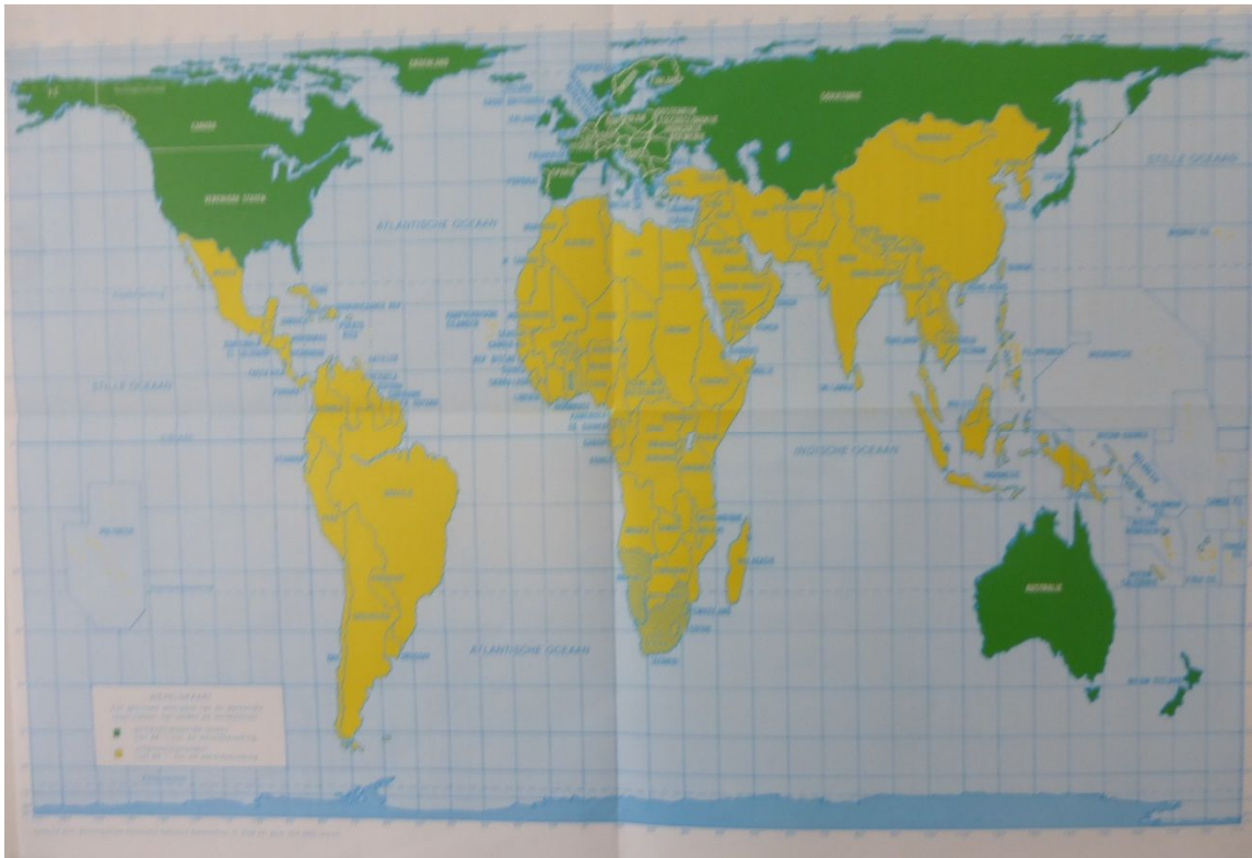
Hierboven: Wereldkaart vanuit het zuiden bekeken