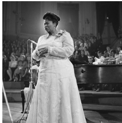
Jackson in Amsterdam, 1961

Ondanks haar bekendheid werd ze nog steeds geweigerd in hotels en andere publieke plaatsen. Mahalia werkte samen met Martin Luther King in de strijd voor gelijke rechten. Mahalia door te zingen, King door te spreken. Zo werd de gospelmuziek de soundtrack van de Civil Rights Movement. Ze stierf op 60 jarige leeftijd aan kanker in 1972. Tienduizenden mensen kwamen samen om haar te gedenken.