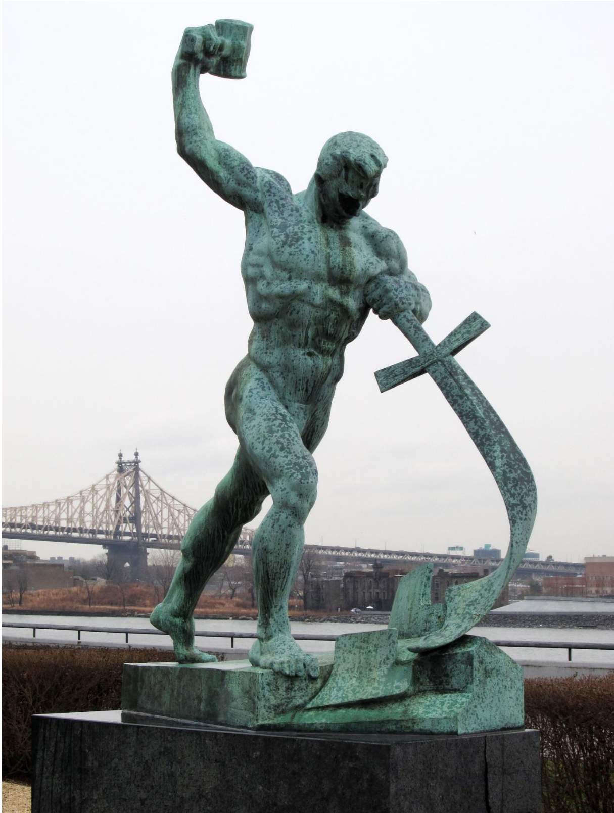
Afbeelding 1. Zwaarden omsmeden tot ploegscharen, beeld gemaakt door Jewgeni Wutschetitsch - Geschenk van de Sovjetunie aan de Verenigde Naties (1959). Staat bij het gebouw van de Verenigde Naties in New York. 1