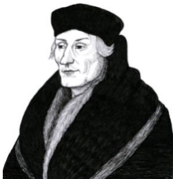
Afbeelding 2 https://oll.libertyfund.org/person/desiderius-erasmus

Erasmus (geboren in Rotterdam en overleden in Bazel)