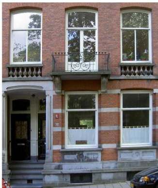
Afbeelding 3. Quakercentrum Amsterdam

Meer dan de helft van de Quakers in het gebied blijkt slaven te houden. Maar de aanhoudende gesprekken in geloof leiden er toch in 1754 toe dat de Quakers zich als eersten in Philadelphia officieel tégen de slavernij uitspreken.