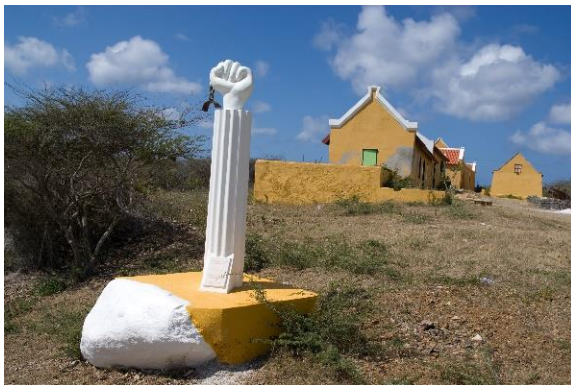
Afbeelding 2 Standbeeld voor Tula

Maar ondanks het feit dat het leven van Tula grote invloed heeft gehad op de geschiedenis van Curaçao, is de ware toedracht en reden van de opstand door de Nederlandse machthebbers lang verzwegen. Je vindt in geschriften Tula beschreven als: 'Het opperhoofd der rebbellige negers'.