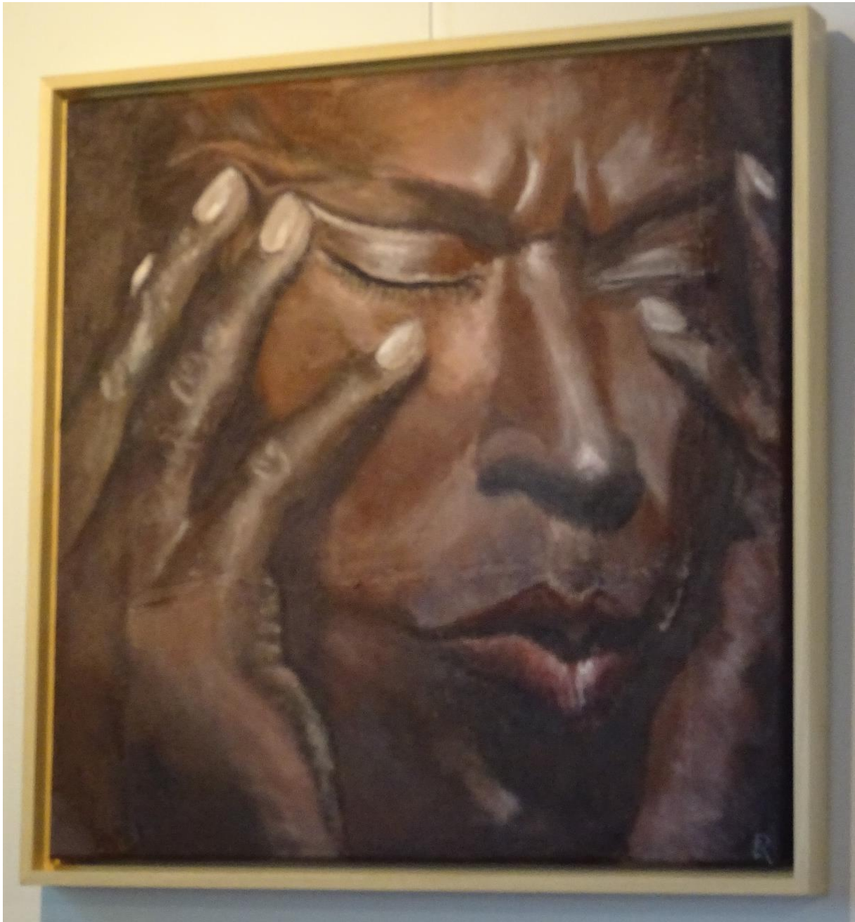
Afbeelding 1. Tutu portret geschilderd door Ciska Rook

Desmond Tutu geeft de aanwezige studenten en kijkers in College Tour met Twan Huys een boodschap van hoop. Hij zegt: